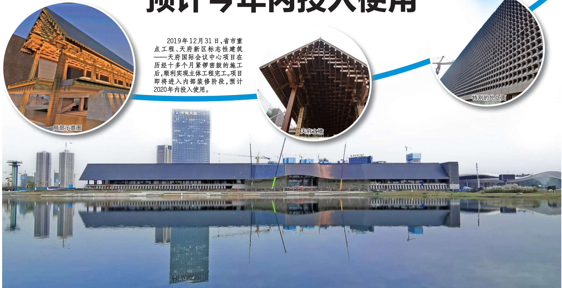
主体完工的天府国际会议中心初显魅力